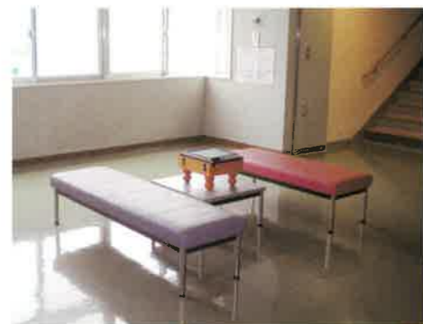
■談話コーナー (2・3・4階)